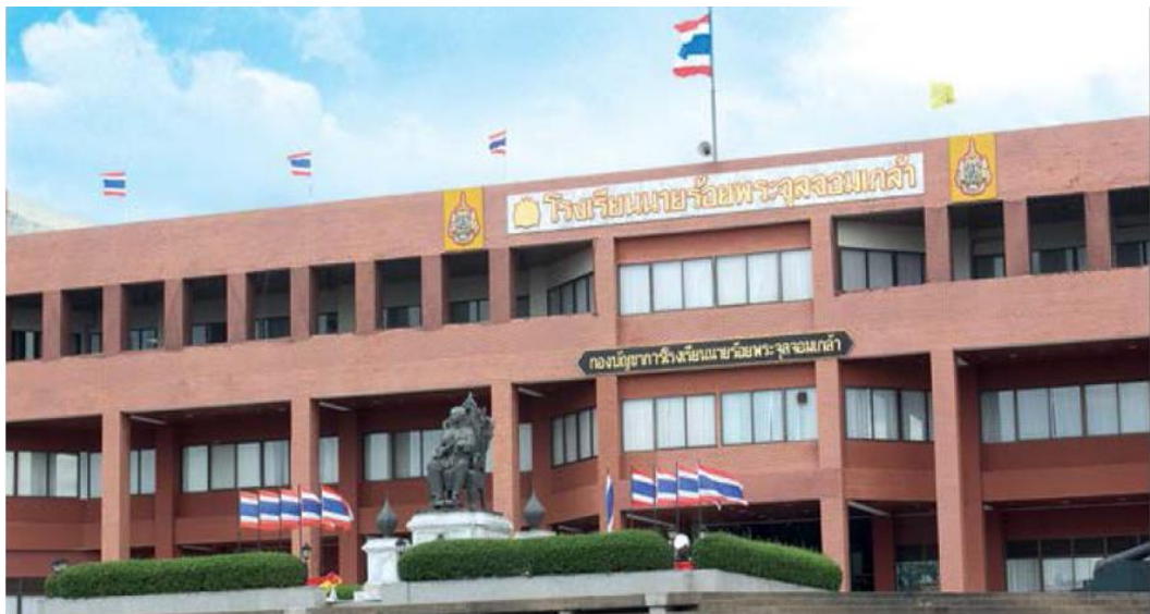
รูปที่ 1.2 กองบัญชาการโรงเรียนนายร้อยพระจุลจอมเกล้า

โรงเรียนนายร้อยพระจุลจอมเกล้าได้พัฒนาหลักสูตรการศึกษาให้เหมาะสมกับยุคสมัย นับตั้งแต่หลักสูตรการศึกษาระดับมัธยมศึกษา และวิชาทหารหลักสูตรตามแนวทางของโรงเรียนโปลีเทคนิค ประเทศฝรั่งเศส 5 ปี หลักสูตรตามแนวทางของโรงเรียนนายร้อยทหารบกเวสต์ปอยต์ ประเทศสหรัฐอเมริกา 5 ปี ต่อมาในปี 2544 ได้ปรับปรุงหลักสูตรเหลือ 4 ปี เพื่อให้สอดคล้องกับนโยบายการศึกษาของกองทัพบก และมติคณะกรรมการพัฒนาระบบการศึกษาของกองทัพบก ใช้ชื่อหลักสูตรว่า “หลักสูตรนักเรียนนายร้อยโรงเรียนนายร้อยพระจุลจอมเกล้า พุทธศักราช 2544” ต่อมาหลักสูตรนี้ได้ผ่านการรับรองจากสำนักงานคณะกรรมการการอุดมศึกษาแห่งชาติ เริ่มใช้ตั้งแต่ปี 2544 จนถึงปี 2558 ได้มีการนำหลักสูตร 5 ปี กลับมาใช้ใหม่อีกครั้ง โดยมีการประเมินและปรับปรุงหลักสูตรอย่างต่อเนื่องประกอบด้วย หลักสูตรวิศวกรรมศาสตรบัณฑิต 5 หลักสูตร หลักสูตรวิทยาศาสตรบัณฑิต 2 หลักสูตร และหลักสูตรศิลปศาสตรบัณฑิต 1 หลักสูตร การจัดการศึกษาในแต่ละภาคการศึกษาประกอบด้วย การศึกษาวิชาการ วิชาทหาร และการเสริมสร้างคุณลักษณะผู้นำ