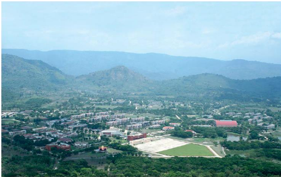
รูปที่ 1.1 โรงเรียนนายร้อยพระจุลจอมเกล้า

โรงเรียนนายร้อยพระจุลจอมเกล้าได้รับพระมหากรุณาธิคุณจากพระบาทสมเด็จพระจุลจอมเกล้าเจ้าอยู่หัว พระราชทานกำเนิด เมื่อวันที่ 5 สิงหาคม 2430 ณ บริเวณพระราชวังสราญรมย์ ต่อมาเมื่อปี 2452 ทรงพระกรุณาโปรดเกล้าฯ ให้ขยายที่ตั้งโรงเรียนนายร้อยชั้นมัธยมมาอยู่ที่ ถนนราชดำเนินนอก เนื่องจากมีผู้นิยมเข้าเรียนจำนวนมากและสถานที่เดิมคับแคบ จนกระทั่งปี 2523 พระบาทสมเด็จพระบรมชนกาธิเบศร มหาภูมิพลอดุลยเดชมหาราช บรมนาถบพิตร ทรงพระกรุณาโปรดเกล้าฯ ให้ย้ายที่ตั้งมาอยู่ที่บริเวณเขาชะโงก จังหวัดนครนายก ด้วยเหตุที่สถานที่ตั้งเดิมแออัด ประกอบกับสภาพแวดล้อมไม่เอื้ออำนวยในการฝึกศึกษา พระบาทสมเด็จพระบรมชนกาธิเบศร มหาภูมิพลอดุลยเดชมหาราช บรมนาถบพิตร เสด็จพระราชดำเนินพร้อมด้วย พลเอกหญิง สมเด็จพระกนิษฐาธิราชเจ้า กรมสมเด็จพระเทพรัตนราชสุดาฯ สยามบรมราชกุมารี ทรงประกอบพิธีวางศิลาฤกษ์ เมื่อ 5 สิงหาคม 2524 และเสด็จพระราชดำเนินมาทรงเปิดโรงเรียนนายร้อยพระจุลจอมเกล้าแห่งนี้ เมื่อ 5 สิงหาคม 2529 ยังความปลาบปลื้มแก่บรรดานักเรียนนายร้อยศิษย์เก่า และกำลังพลของโรงเรียนนายร้อยพระจุลจอมเกล้าอย่างหาที่สุดมิได้